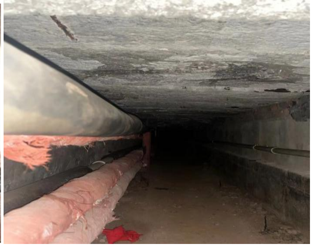
图 2 维修通道现场图