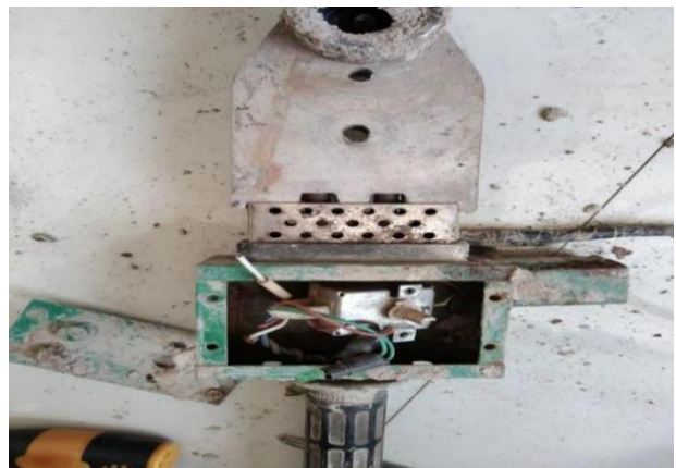
图 6 热熔器内部现场图