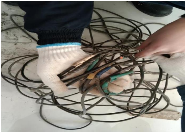
图 3 插板线 1 现场图