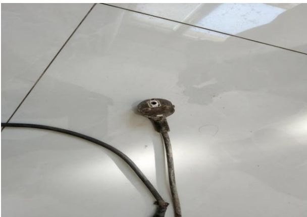
图 5 热熔器插座现场图