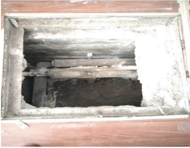
图 1 维修通道入口现场图